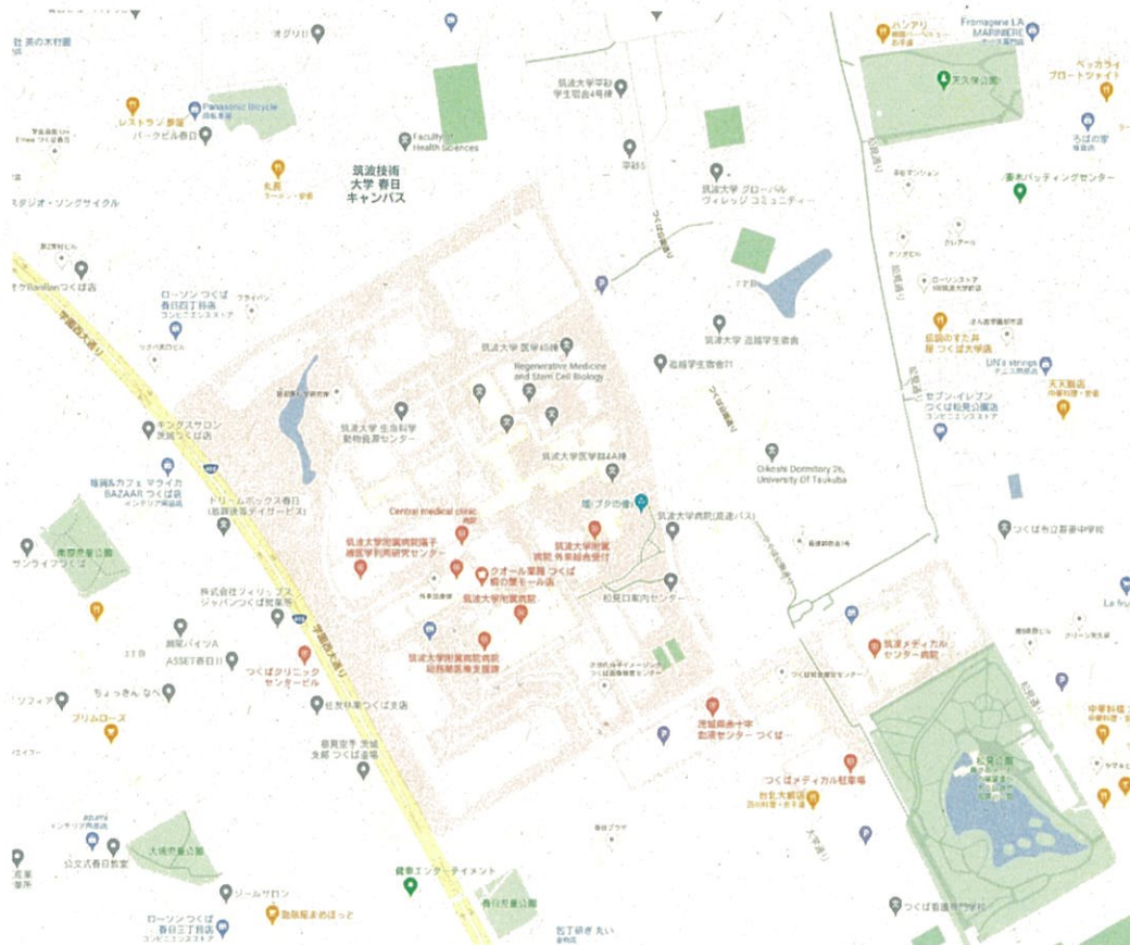
〈筑波大学附属病院全体図〉

なお、平日の9:15~17:15の間に納品する場合は栄養管理室での検収前に医学地区納品検収所において納品確認を受けること(図2)。